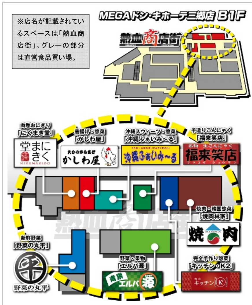
【熱血商店街 フロアマップ】