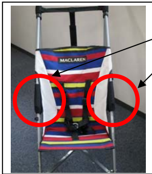
取り付け位置（正面図）

左右セットです。図のジョイント部分を常時覆うカバーとなりますので、装着したままでベビーカーの開閉が出来ます。取り付けについての説明書はカバーと合わせて配布させていただきます。