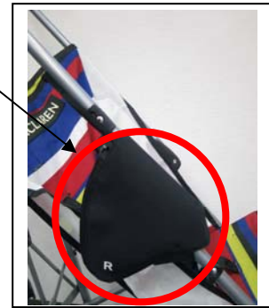
取り付け位置（側面図）

左右セットです。図のジョイント部分を常時覆うカバーとなりますので、装着したままでベビーカーの開閉が出来ます。取り付けについての説明書はカバーと合わせて配布させていただきます。